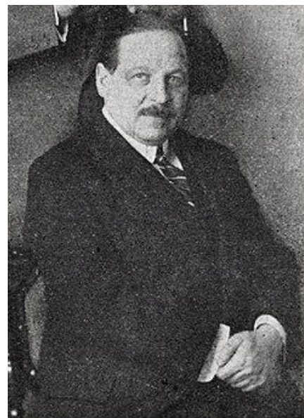
Komponist Emmerich Kálmán

Gratis introduksjon en time før forestilling.